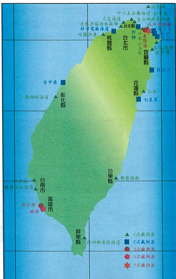
1993~2004 年間台灣本島瘋狗浪事件分布圖